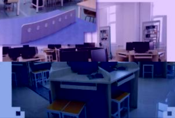
一体化课程教学设计 综合实训室