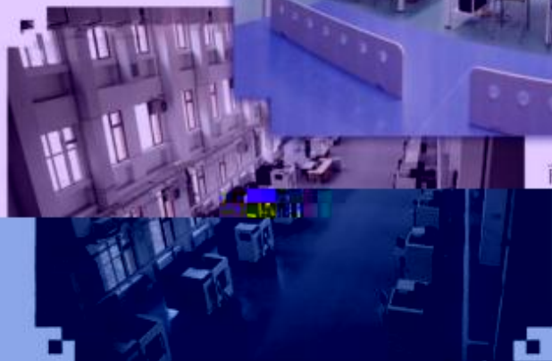
DMG 数控技术 训练场所